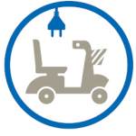
attrezzature disabili cilities for disabled persons fauteuils pour handicapés Roll- und Krankenfahrstühle equipos por inahbles