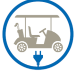
veicoli elettrici electric vehicles véhicules électriques Elektrofahrzeuge vehículos eléctricos