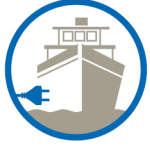
nautica / boating nautisme / Boote nautica