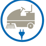
macchine pulizia industriale industrial cleaning machines machines pour le nettoyage industriel Reinigungsmaschinen máquinas de limpieza para la industria