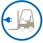
carrelli elevatori / lift trucks chariots elevateurs / Gabelstapler carretillas elevadoras